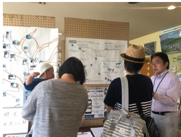
設立メンバーとして活動中